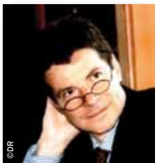
Antoine COMPAGNON Professeur au Collège de France