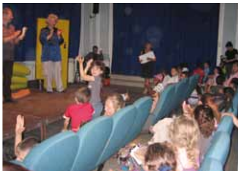
Cérémonie de remise du prix 2011 à Marseille.

18, rue Joseph Serlin – 69001 LYON Téléphone 04 72 00 31 60 Mobile 06 73 68 13 29 Télécopie 04 72 07 70 81 ppl@prixpremierlectures.org